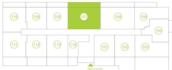
Půdorys podlaží / Floor plan