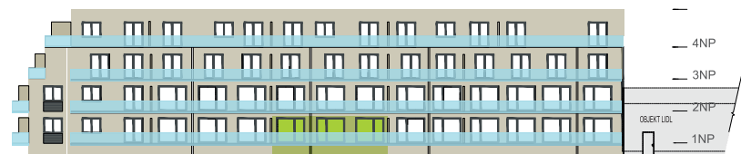
Západní pohled na dům / Building View - west side